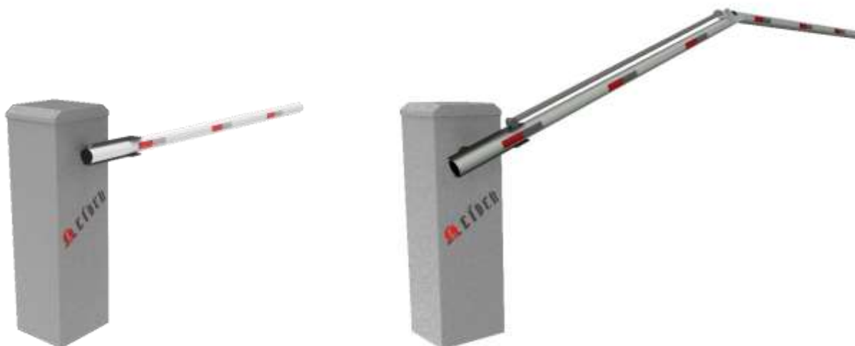
Cancela Automática com haste linear ou articulada em alumínio